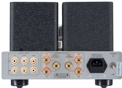
アナログ入力端子は3系統用意され、フロントのセレクタースイッチで切り替えることが可能